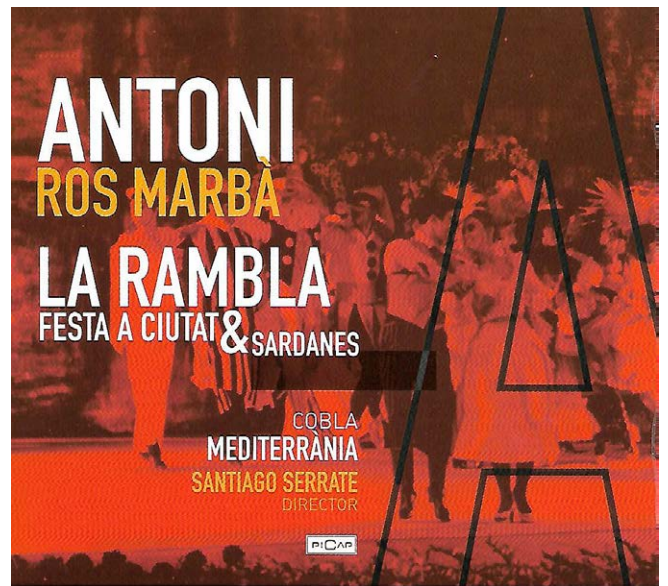
La Rambla. Obres de Ros Marbà. Picap.