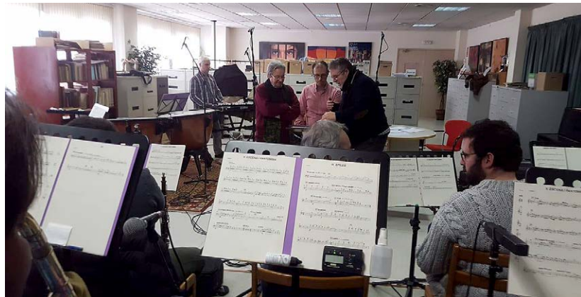
Enregistrament del CD.

Efectivament. Amb l'escolania era com el director assistent i, de fet, vaig dirigir alguns concerts amb 15 o 16 anys. Com que ser director d'orquestra sempre ha estat la meua vocació des de petit, vaig dirigir un parell de concerts dels balls vuitcentistes i un de sardanes quan el director no podia fer-ho a la Jovenívola 2.